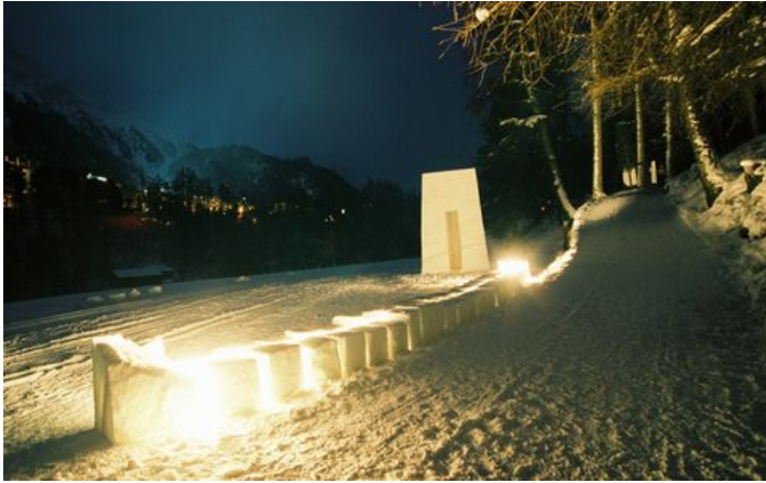
UP! Siegerprojekt an der Nachlöipe Tolais.