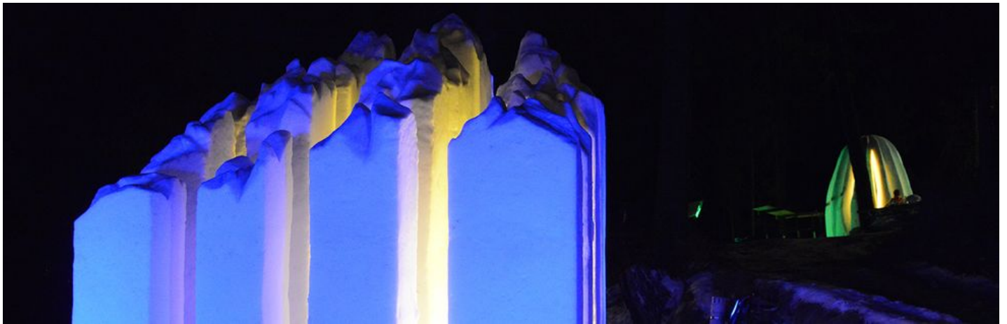
Kunstwege 2015 Foto Erika Saratz2