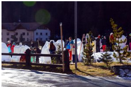
Kids Workshop beim Hotel Walther Pontresina

Höhepunkte waren die Mahlzeiten am Mittag im Restaurant Sportpavillon, Restaurant Kochendörfer, Grand Hotel Kronenhof und am Abend im Hotel Post und Hotel Saratz.