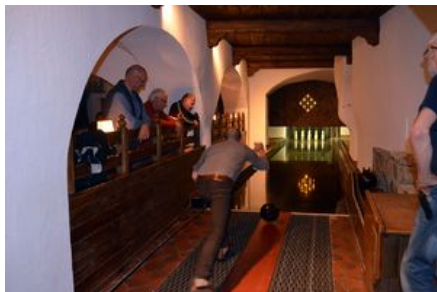
Traditional Bowling im Grandhotel Kronenhof Pontresina