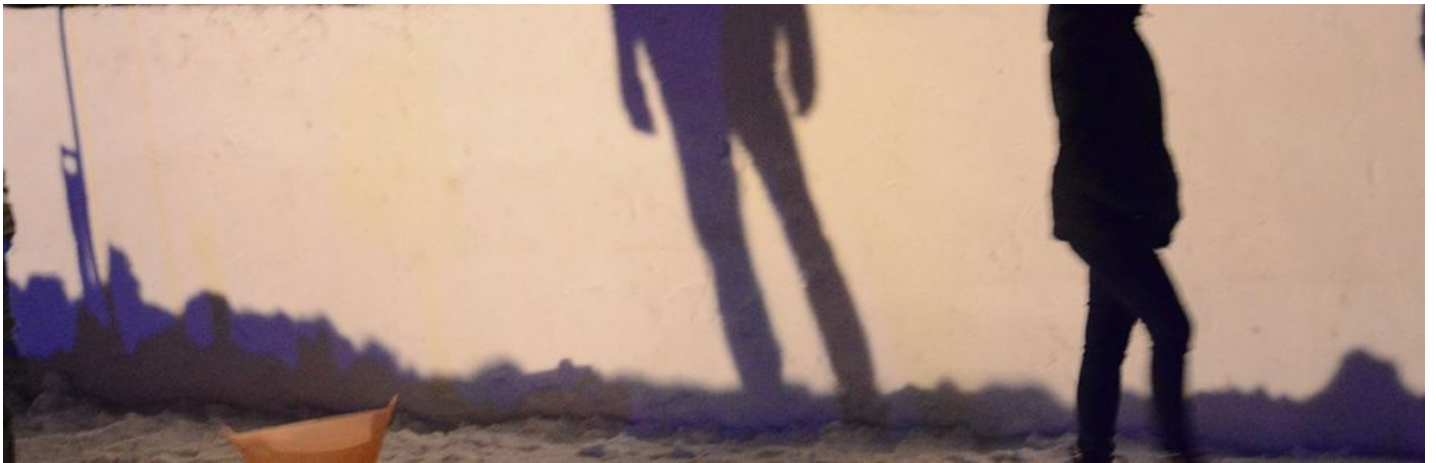
Kunstwege 20154