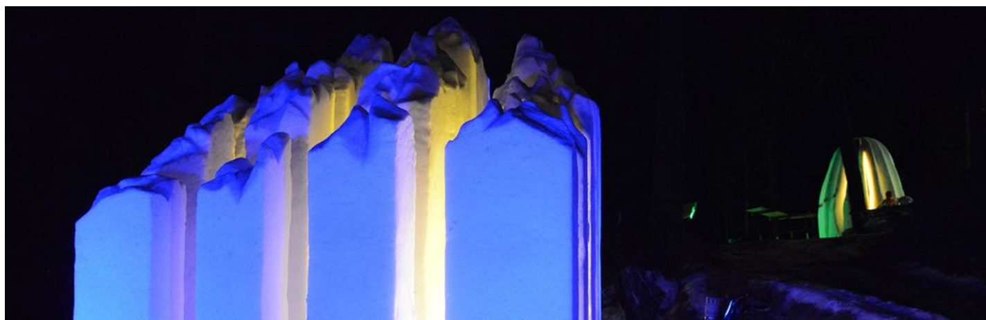
Kunstwege 2015