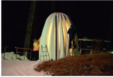
Team Matsumura JPN beim Finish vor der Jurierung