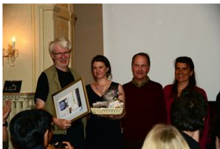
Team Chilcott SWE DNK Gewinner des diesjährigen Wettbewerbs