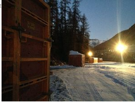
mit Kunstschnnee gefüllte Schalungen erstellt vom Werkteam Pontresina