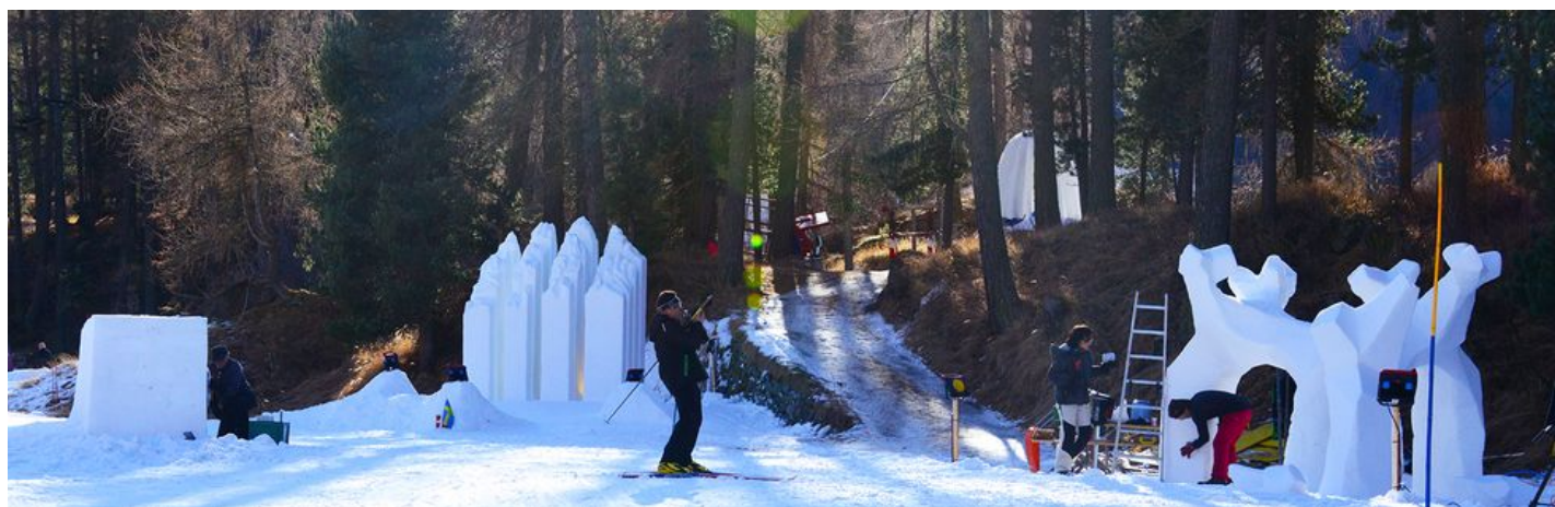
Kunstwege 2015