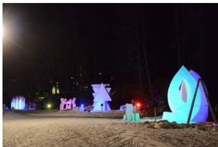
Die neue LED Lichttechnik