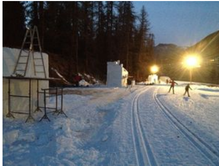
Standorte Schlosswiese Pontresina