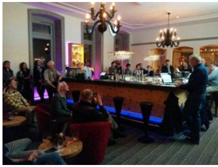
Das Briefing der Teams fand am Samstag, 12.12.2015 statt

Einladung Vernissage 18.12. 2015 Download Karte PDF (268KB)