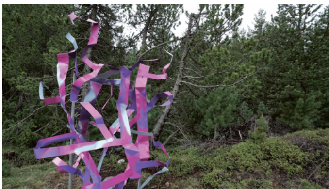
20 Schweizer Kunstschaffende stellen ihre Werke an 32 Standorten aus.

Die Ausstellung ist so konzipiert, dass sie bei einem Spaziergang, beim Wandern oder Biken sowie als Hop-on-Hop-off Tour besichtigt werden kann: Die Kunstwerke in Pontresina sind in einem einfach begehbaren Dorfrundgang zu entdecken.